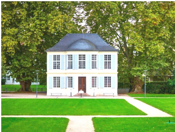
Billetsche Schlösschen Offenburg

Verreisen Sie mit uns. Wir freuen uns auf schöne Urlaubstage mit Ihnen!