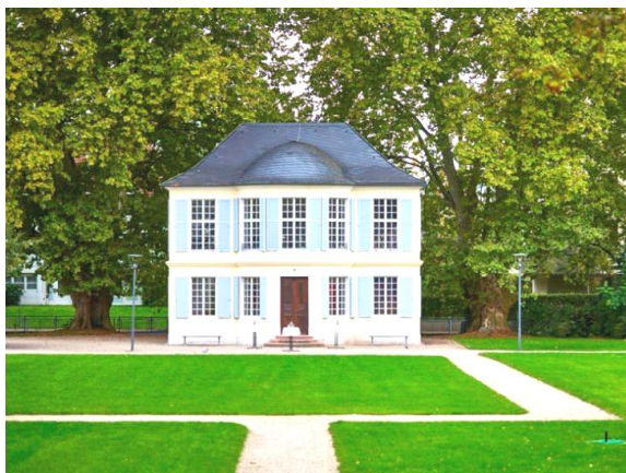
Billetsche Schlösschen Offenburg

Verreisen Sie mit uns. Wir freuen uns auf schöne Urlaubstage mit Ihnen!